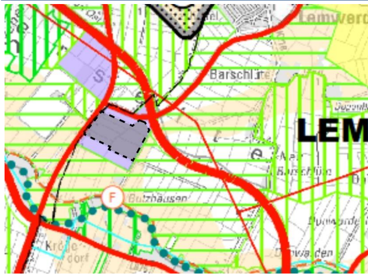
Abb. 2 Darstellung des Plangebiets im RROP des Landkreises Wesermarsch

Das Plangebiet liegt innerhalb eines Vorranggebiets für Industrielle Anlagen und Gewerbe (lila). Angrenzend finden sich Vorbehaltsgebiete für die Landwirtschaft (gelb) sowie die landschaftsbezogene Erholung (grün quergestreift), die sich teilweise überlagern. Nördlich und östlich befinden sich zudem Vorranggebiete Grünlandbewirtschaftung, -pflege, und -entwicklung (grün längsgestreift). Die im Westen angrenzende Motzener Straße (L 875) sowie die im Norden angrenzende Industriestraße werden als Straße von regionaler Bedeutung (rot) dargestellt. Nordöstlich verläuft die Trasse der geplanten B 212n. Diese wird im RROP als Vorranggebiet Hauptverkehrsstraße (rot) dargestellt.