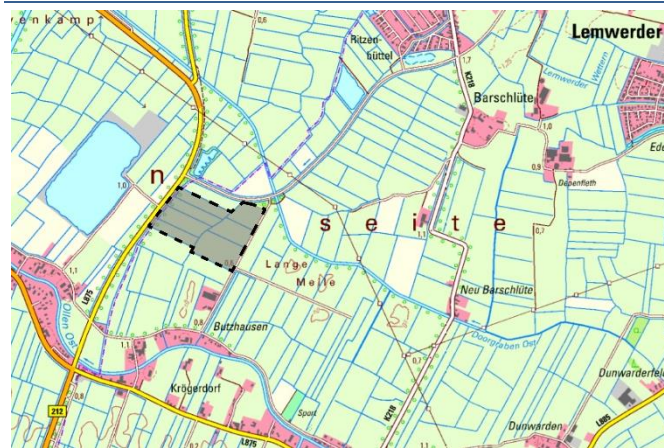
Abb. 1 Abgrenzung des Änderungsbereichs der 18. Änderung des FNP

Die räumliche Abgrenzung wird kartographisch durch die Planzeichnung der 2. Änderung des Flächennutzungsplans im Maßstab 1:5000 bestimmt.